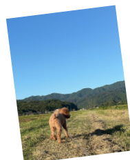
愛犬と散歩したときのお気に入りの写真です

趣味はランニングやゲームをすることです。外の風を感じながら、ゆるく走って気持ちを整えたり、愛犬と散歩したりと、のんびりと過ごしています。