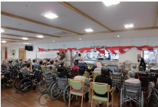
賀寿のお祝いをさせて頂き、施設より記念品をお贈りさせて頂きました。