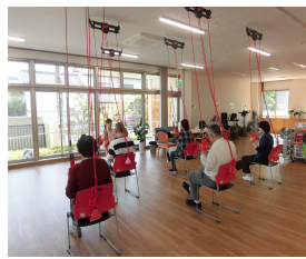
短時間通所リハビリ