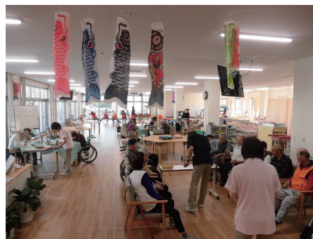
午後からの全体風景