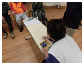
カフェインホール